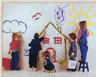
Gemeinsam macht's mehr Spaß: Kinder brauchen das kreative Spiel in der Gruppe

Monaten. Auch hierzulande werden schon Programme für Zwei- bis Dreijährige angeboten. Experten befanden aber in der Zeitschrift „Ökotest“, dass ein Einstieg ins Computerleben frühestens